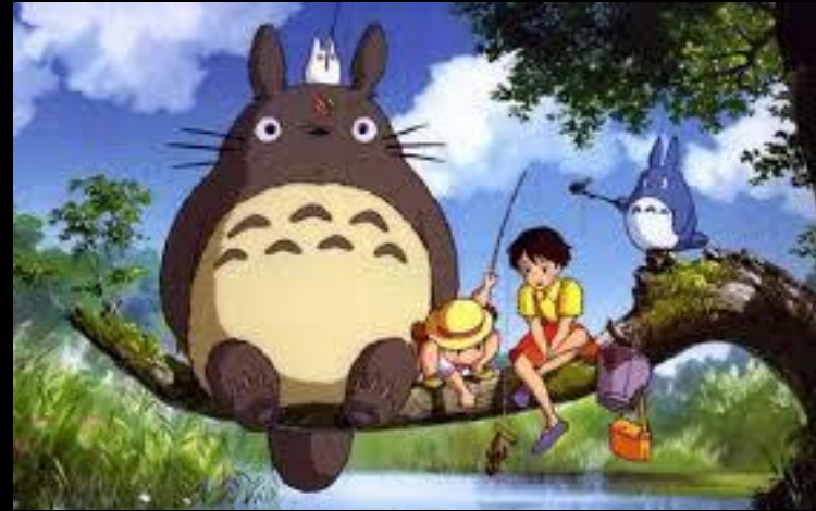
Mon voisin Totoro