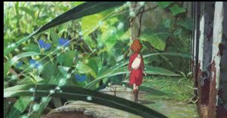
Arrietty, le petit monde des charpadeurs