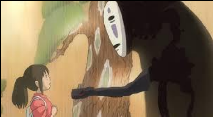
Le voyage de Chihiro