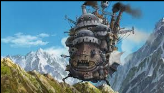
Le château ambulant