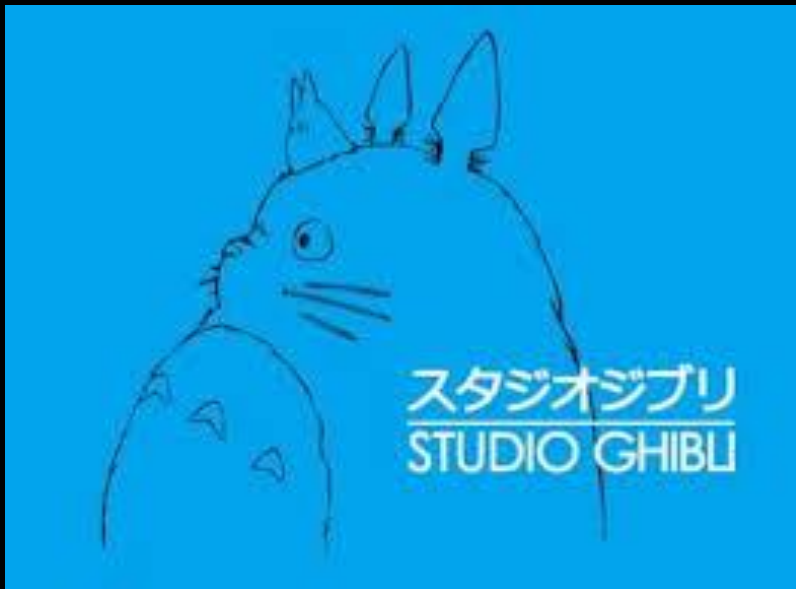
Le logo de studio Ghibli